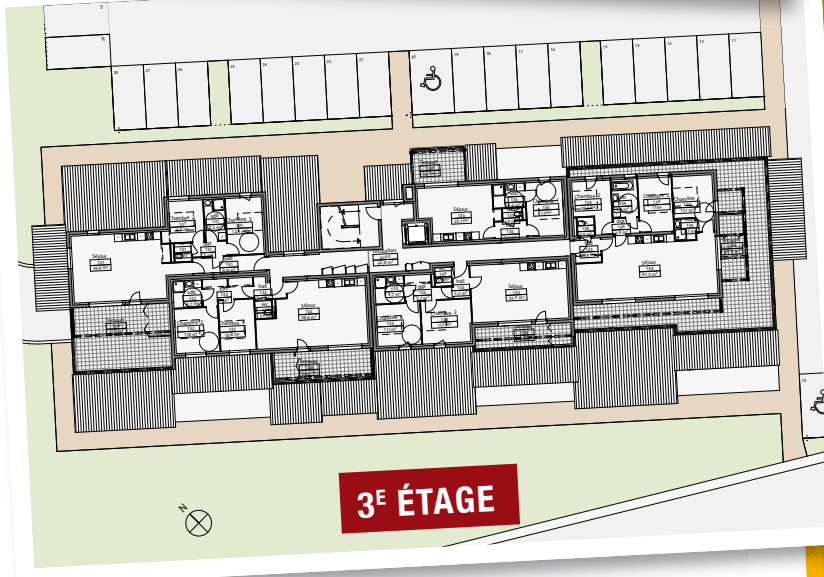
3 E ÉTAGE